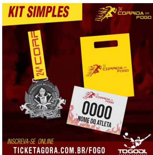
KIT SIMPLES IMAGEM ILUSTRATIVA

7.1.2 - Kit Simples: contém número de peito, chip, sacola plástica personalizada com brindes dos patrocinadores (se houver) e medalha para quem concluir a prova. O valor oficial da inscrição é de R$ 50,00 (cinquenta reais) e será disponibilizado com desconto para aqueles que se inscreverem antecipadamente e custará R$ 45,00 (quarenta e cinco reais) até 06 de novembro de 2019 e R$ 50,00 (cinquenta reais) a partir de 07 de novembro de 2019 até o fim das inscrições. O quantitativo de vagas pode variar para mais ou menos de acordo com a coordenação do evento e no momento em que achar oportuno.