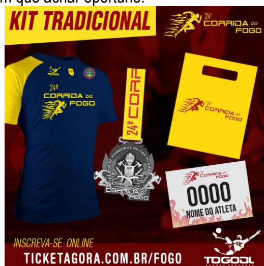
KIT TRADICIONAL IMAGEM ILUSTRATIVA

7.1.3 - Kit Tradicional: contém camisa fabricada pela Mantle no tecido Fastrun, número de peito, chip, sacola plástica personalizada com brindes dos patrocinadores (se houver) e medalha para quem concluir a prova. O valor oficial da inscrição é de R$ 80,00 (oitenta reais) e será disponibilizado com desconto para aqueles que se inscreverem antecipadamente e custará R$ 70,00 (setenta reais) até 06 de novembro de 2019 e R$ 80,00 (oitenta reais) a partir de 07 de novembro de 2019 até o fim das inscrições. O quantitativo de vagas pode variar para mais ou menos de acordo com a coordenação do evento e no momento em que achar oportuno.