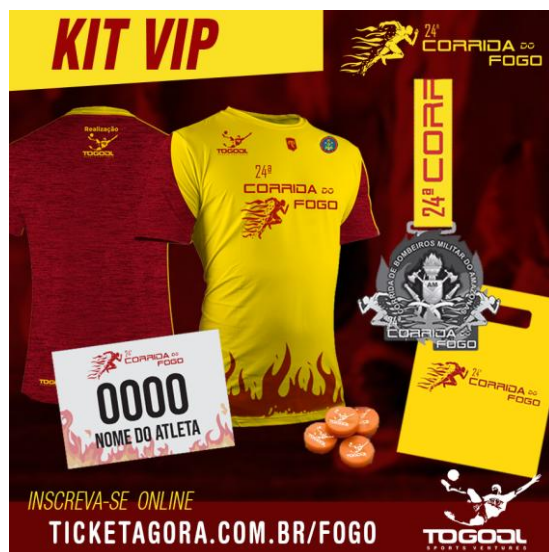
KIT VIP IMAGEM ILUSTRATIVA

7.1.4 - Kit VIP: contém camisa fabricada pela Mantle no tecido Mescla Techrun, clip bottom para número de peito, número de peito, chip, sacola plástica personalizada, brindes dos patrocinadores (se houver) e medalha para quem concluir a prova. O valor oficial da inscrição é de R$ 120,00 (cento e vinte reais) e será disponibilizado com desconto para aqueles que se inscreverem antecipadamente e custará R$ 100,00 (cem reais) até 06 de novembro de 2019 ou mais 100 vagas e R$ 120,00 (cento e vinte reais) a partir de 07 de novembro de 2019 até o fim das inscrições. O quantitativo de vagas pode variar para mais ou menos de acordo com a coordenação do evento e no momento em que achar oportuno.