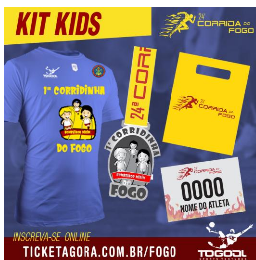
KIT KIDS IMAGEM ILUSTRATIVA

7.1.5 - A Corrida Kids terá o valor único de R$ 55,00 (cinquenta e cinco reais) e o kit contém: camisa tradicional, número de peito, sacola plástica personalizada com brindes dos patrocinadores (se houver) e medalha para quem concluir a prova.