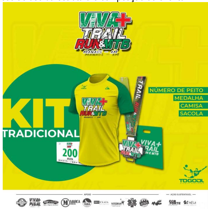
KIT TRADICIONAL IMAGEM ILUSTRATIVA

7.1.3 - KIT TRADICIONAL : contém camisa em poliamida, número de peito, sistema de controle de tempo, seguro contra acidentes pessoais, sacola plástica personalizada com brindes dos patrocinadores (se houver) e medalha para quem concluir a prova, além do acesso ao uso da estrutura e competição do evento.