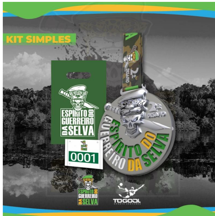
KIT SIMPLES IMAGEM ILUSTRATIVA

7.1.2.1 - Para as modalidades MOUNTAIN BIKE e TRAIL RUN o valor oficial da inscrição é de R$ 110,00 (cento e dez reais) e será disponibilizado com desconto para aqueles que se inscreverem antecipadamente e custará R$ 100,00 (cem reais) até 12 de julho de 2021 e R$ 110,00 (cento e dez reais) a partir de 13 de julho de 2021 até o fim das inscrições. O quantitativo de vagas pode variar para mais de acordo com a coordenação do evento e no momento em que achar oportuno.