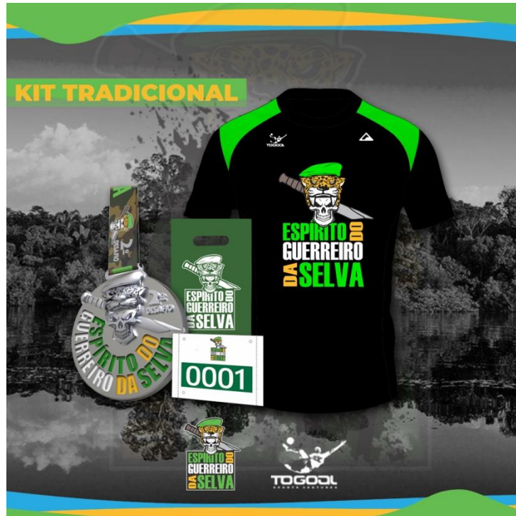
KIT TRADICIONAL IMAGEM ILUSTRATIVA

7.1.3.1 - Para as modalidades MOUNTAIN BIKE e TRAIL RUN o valor oficial da inscrição é de R$ 160,00 (cento e sessenta reais) e será disponibilizado com desconto para aqueles que se inscreverem antecipadamente e custará R$ 150,00 (cento e cinquenta reais) até 13 de julho de 2021 e R$ 160,00 (cento e sessenta reais) a partir de 13 de julho de 2021 até o fim das inscrições. O quantitativo de vagas pode variar para mais de acordo com a coordenação do evento e no momento em que achar oportuno.