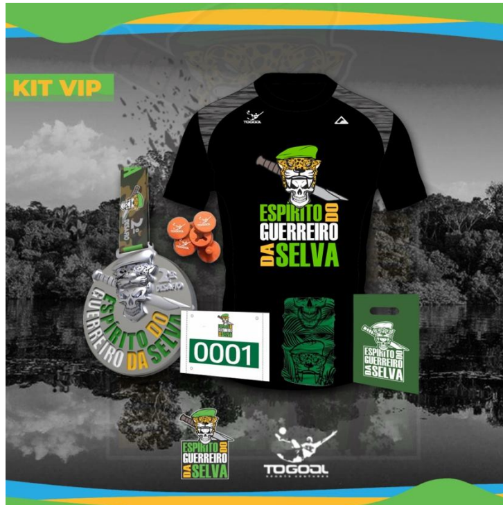
KIT VIP IMAGEM ILUSTRATIVA

7.1.4.1 - Para as modalidades MOUNTAIN BIKE e TRAIL RUN o valor oficial da inscrição é de R$ 250,00 (duzentos e cinquenta reais) e será disponibilizado com desconto para aqueles que se inscreverem antecipadamente e custará R$ 225,00 (duzentos e vinte e cinco reais) até 12 de julho de 2021 e R$ 250,00 (duzentos e cinquenta reais) a partir de 13 de julho de 2021 até o fim das inscrições. O quantitativo de vagas pode variar para mais de acordo com a coordenação do evento e no momento em que achar oportuno.