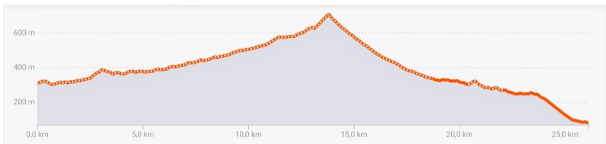
Item 23 – Mapa percurso 26K:pa percurso 26K:

22% PAVIMENTADO 78% DE TERRA 0% NÃO ESPECIFICADO