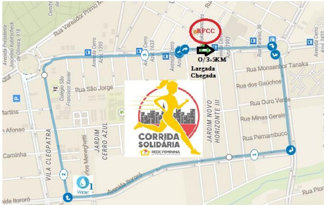
Figura 2 - Percurso da Caminhada 3,5 Km da Rede Feminina de Combate ao Câncer