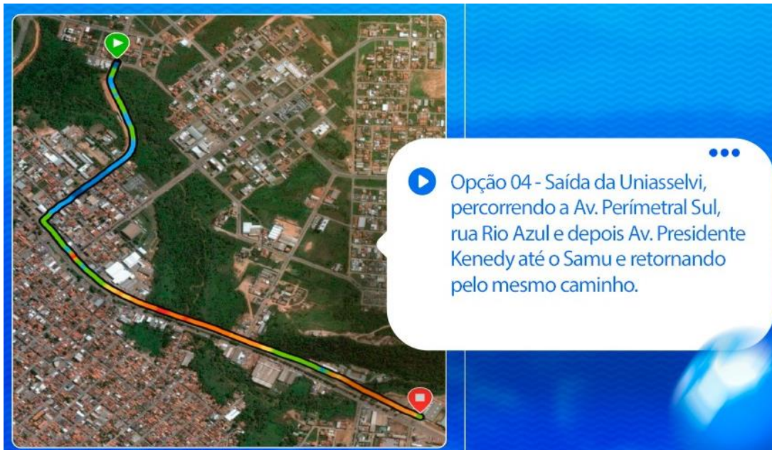
Figura 1: Percurso da corrida