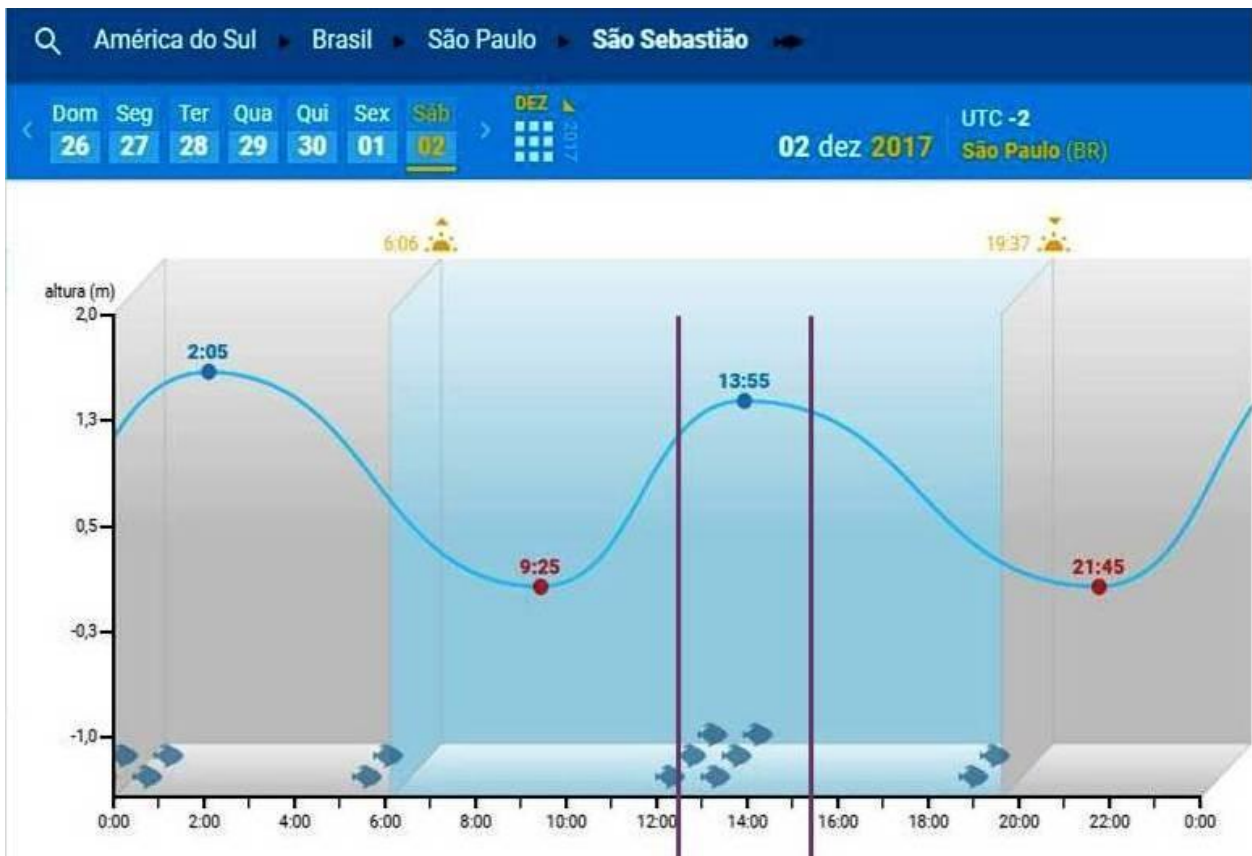
Tábua de Marés para o dia:

Natação – Volta de 750 m Sprint – 1 Volta Olímpico – 2 Voltas