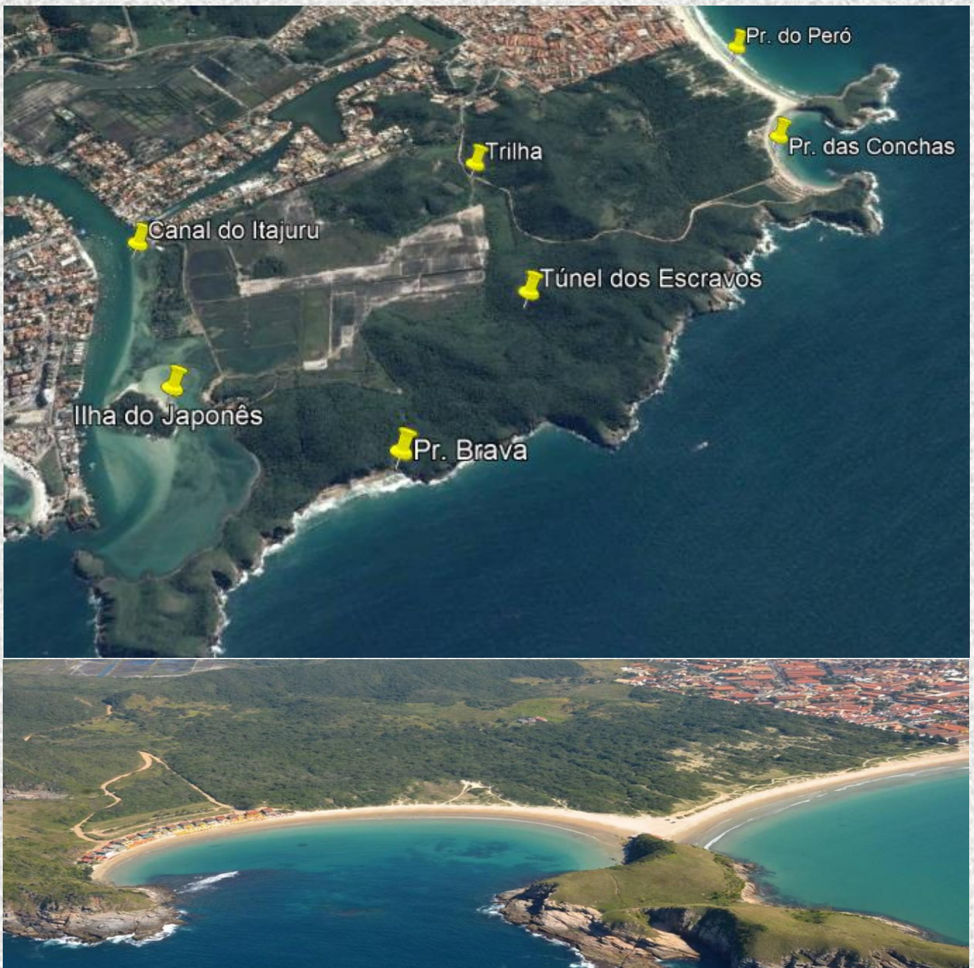
Imagem do Local da Prova

A área apresenta várias trilhas, possui praias belíssimas, um litoral com vistas deslumbrantes e natureza exuberante, o que a torna um excelente local para a prática de esportes ao ar livre.