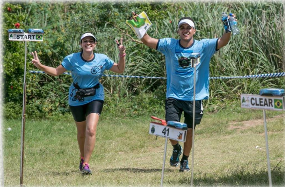
IMAGENS DO HUNTER RACE 2016

Toda a equipe deve passar obrigatoriamente por todos os PC de acordo com seu planejamento e sua conduta estratégica. Nesses PC haverá a presença de staffs .