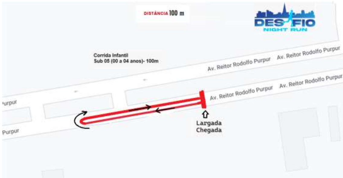
Figura 3 - Percorso Infantil Sub-05 (00 a 04 anos)-100m