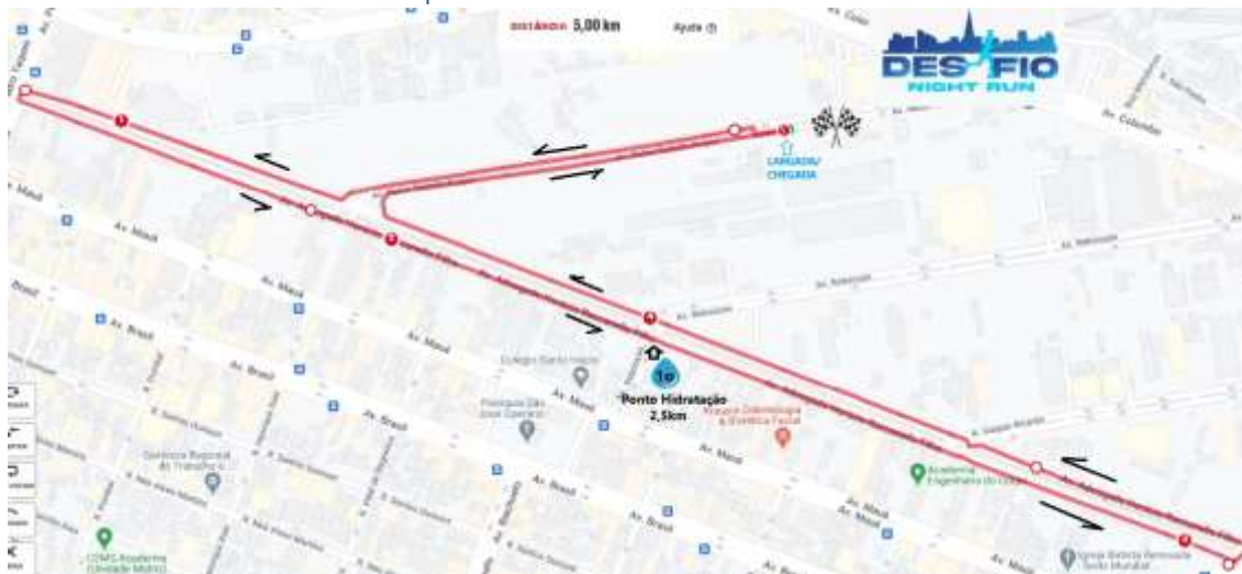
Figura 1 - Percurso Principal 5km - - https://www.mapmyrun.com/routes/view/6267576403