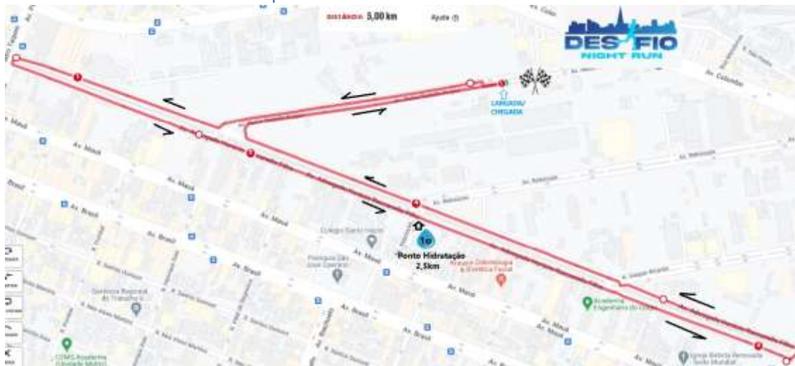
Figura 1 - Percurso Principal 5km - - https://www.mapmyrun.com/routes/view/6267576403