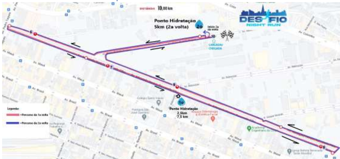
Figura 2 - Percurso Principal 10km