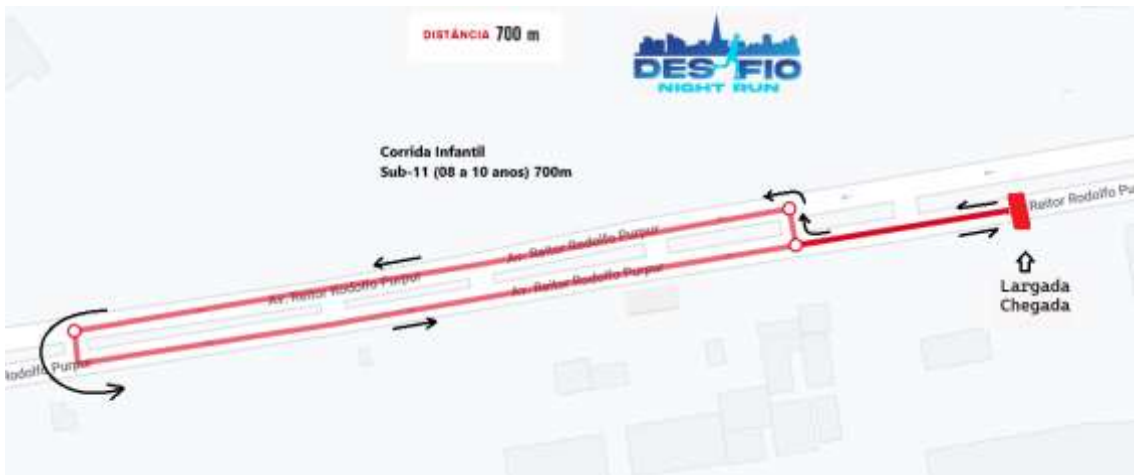
Figura 5 - Percurso Infantil Sub-11 (08 a 10 anos)-700m