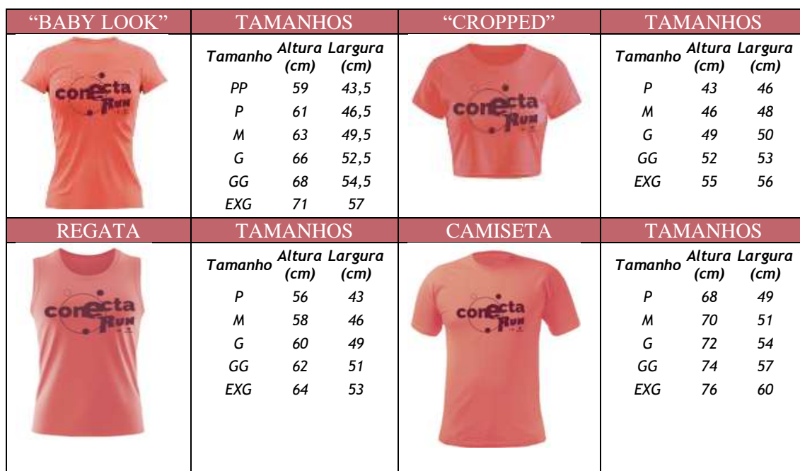
Tabela 2 - Modelos e Tamanhos das camisetas.

3.4 As inscrições serão efetuadas até 12 de março de 2025, ou quando atingirem o limite técnico do evento, no site: www.eucorro.com , mediante o pagamento da taxa de inscrição. A inscrição só será efetivada após a confirmação de pagamento. O PARTICIPANTE deve guardar o comprovante de pagamento, para eventual comprovação no dia da retirada do kit.