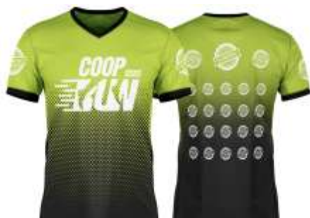
Figura 1 - Imagem ilustrativa da camiseta

Os tamanhos das camisetas seguirão a grade: “Baby Look” (tamanho único M), P, M, G, GG, EXG.