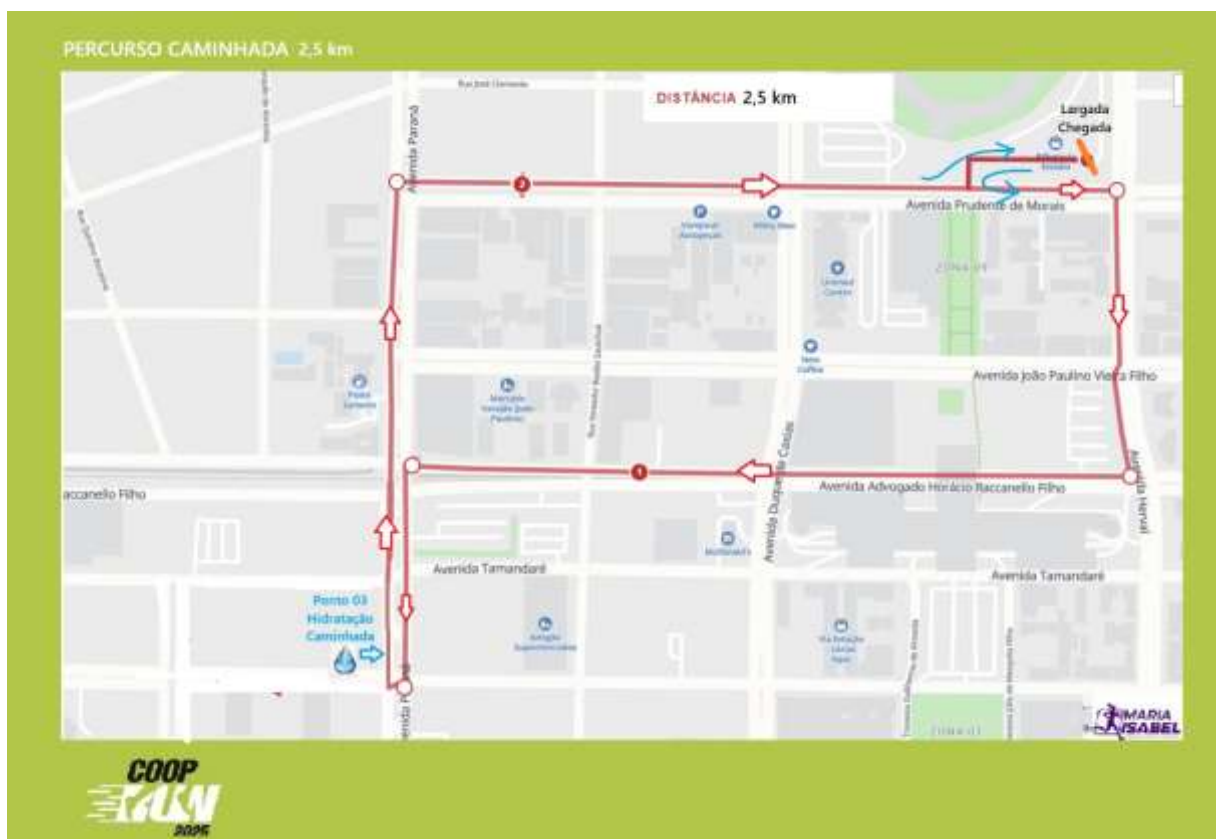
Figura 3 - Percurso da Caminhada 2,5 km